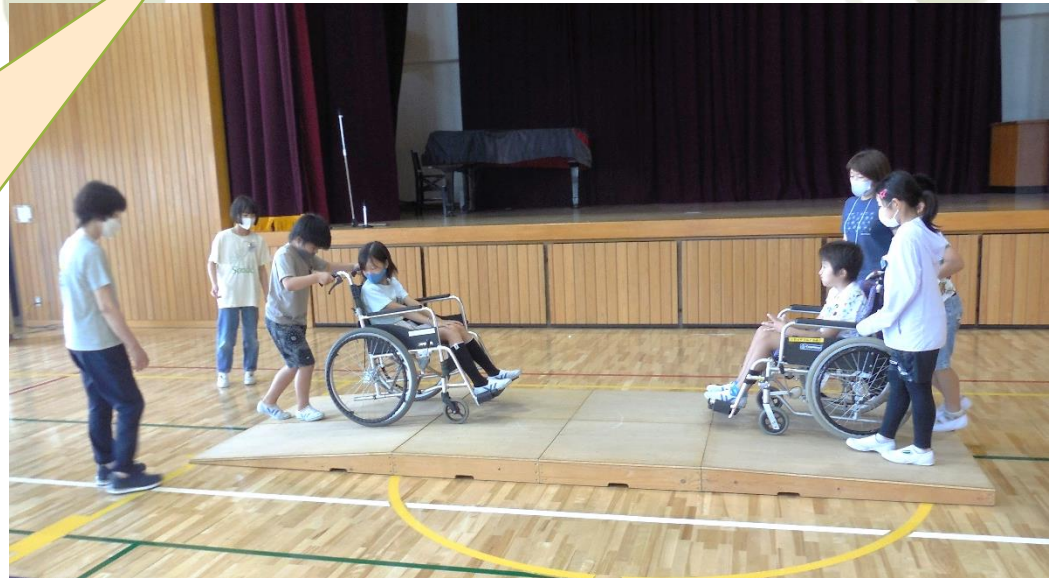
↑学校で実施した「車イス体験」のようす

身近な地域、学校生活などで「ふくしの心」を育て、理解を深めていただく機会として、職員とボランティアが出向いています 分かりやすさと、当事者とのふれあいを大切にした福祉学習プログラムを提供しています