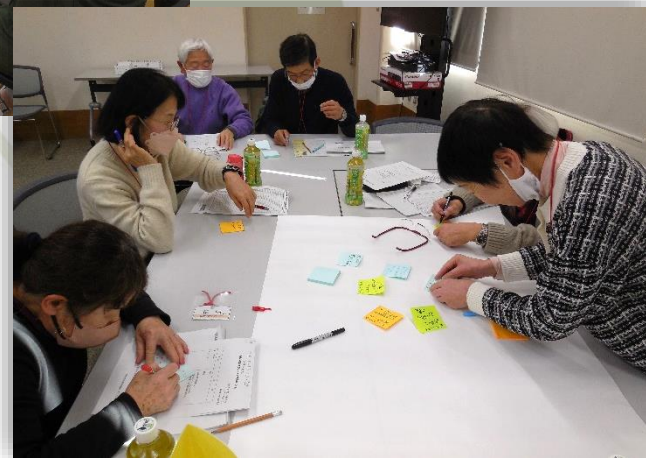
ボランティア交流会の 企画もしています→