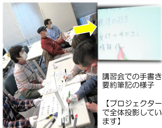
講習会での手書き要約筆記の様子

音声情報を文字にして通訳することで、話の内容がわかり、会話に参加したり情報を得たりすることができます。