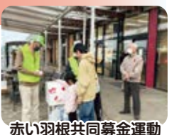
赤い羽根共同募金運動