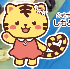
公式キャラクター しもとらちゃん