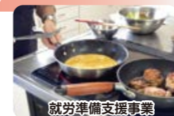
就労準備支援事業