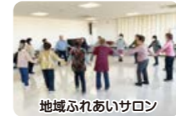
地域ふれあいサロン