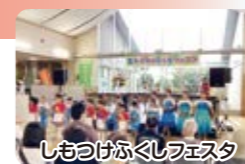
しもつけふくしフェスタ