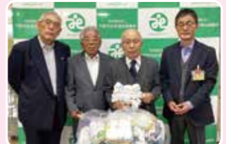
栃木県退職公務員連盟小山支部様