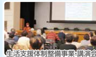
生活支援体制整備事業:講演会