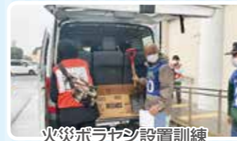
火災ボラセン設置訓練