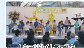
しもつけふくしフェスタ