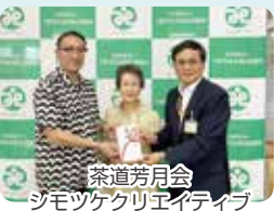
茶道芳月会 シモツケクリエイティブ