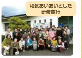
和気あいあいとした研修旅行

場所:市民活動センター、支部ごとに各公民館 人数:会員数161名 内容:更生保護活動、青少年育成、学校支援等