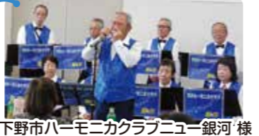
下野市ハーモニカクラブニュー銀河様

普段耳にするの少ない合唱やハーモニカの演奏が聴けて良かった。別の機会でもお願いしたいです。