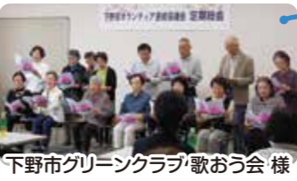
下野市グリーンクラブ歌おう会様