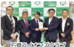
石橋ライオンズクラブ