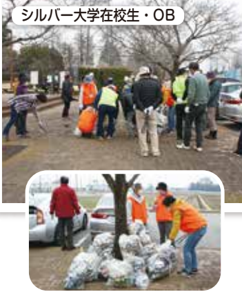
シルバー大学在校生・OB

おもちゃの図書館では、コロナ感染防止のため活動の中止が続いていましたが、昨年12月久しぶりに障がい児の親子と会員のボランティアさんのお孫さん、学生ボランティアさんのお礼の会も兼ねて、クリスマス会を開催しました。みんなでゲームをしたり、サンタさんからプレゼントをもらったり、子どもと保護者たちの笑顔で溢れた一日を過ごしました。コロナ禍の中でも、「できること」をみんなで話し合い活動をしています。