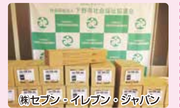
(株)セブシ・イセボン・ジャパン