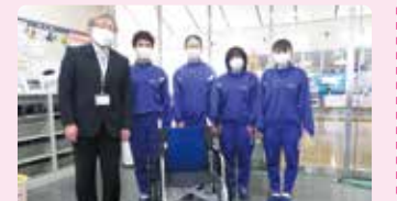
南河内第二中学校 福祉委員会