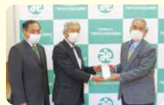
下野市議会親睦会様