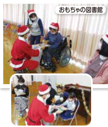
おもちゃの図書館

おもちゃの図書館では、コロナ感染防止のため活動の中止が続いていましたが、昨年12月久しぶりに障がい児の親子と会員のボランティアさんのお孫さん、学生ボランティアさんのお礼の会も兼ねて、クリスマス会を開催しました。みんなでゲームをしたり、サンタさんからプレゼントをもらったり、子どもと保護者たちの笑顔で溢れた一日を過ごしました。コロナ禍の中でも、「できること」をみんなで話し合い活動をしています。