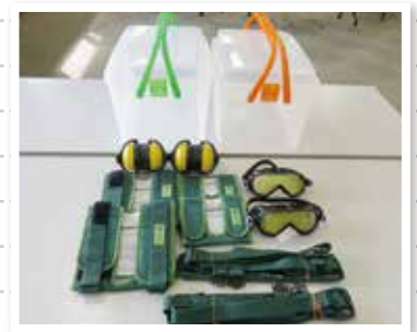
高齢者疑似体験用具の一部です

地域の皆様から寄せられたプルタブを換金し、集まった資金で「福祉用具」として50,360円を使用し、購入しました。皆様のご協力に心より感謝し、大切に活用させていただきます。